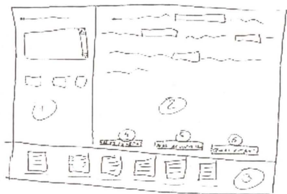
Figura 4 – Protótipo B

A interface sugere, a cada momento, a frase que corresponde ao elemento mais provável nesse momento, com base nos resultados da análise relacional efectuada no estudo prévio (Área 2).